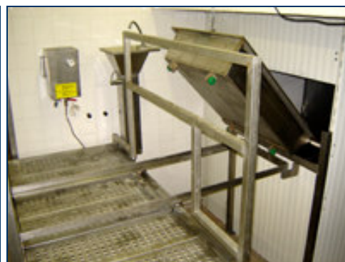
golirea tăvii prin tobogan